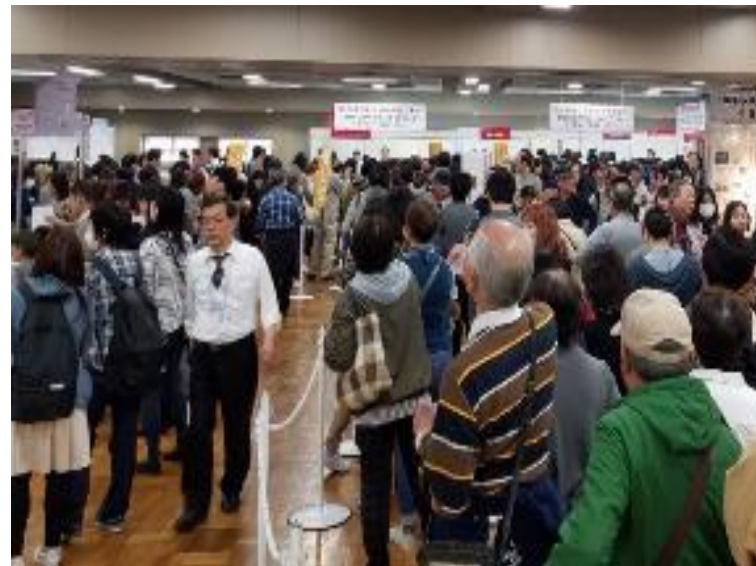
郵便局臨時出張所