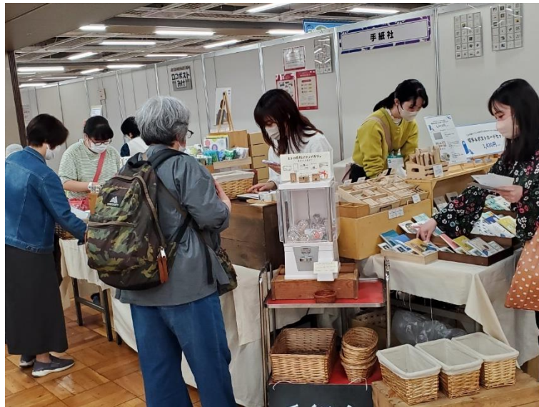
テーブル型式ブース