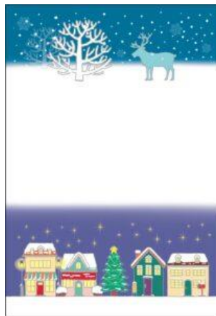
クリスマス展での実施例（2024年）