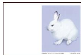
図案: 2円普通切手「エゾユキウサギ」