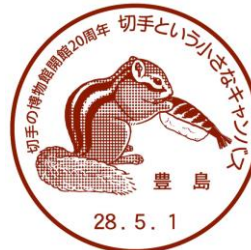
名称: 切手の博物館開館20周年 切手という小さなキャンパス 図案: 3円普通切手「シマリス」と海外年賀切手「寿司」