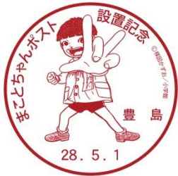
名称: まことちゃんポスト設置記念 図案: まことちゃんグワシのポーズ