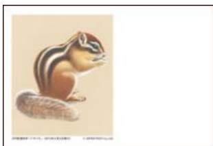
図案: 3円普通切手「シマリス」