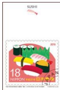
図案: 海外年賀切手(差額用)「寿司」