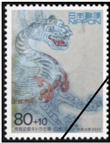
1番 キトラ古墳の壁画（白虎）