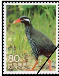
3番 ヤンバルクイナ