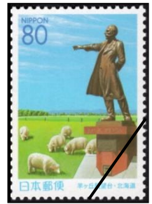
5番 羊ヶ丘展望台（クラーク博士）