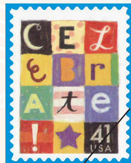
グリーティング切手 祝賀 アメリカ (2007年発行) 切手拡大率135%